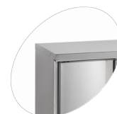
Tillgänglig utan stänkskydd